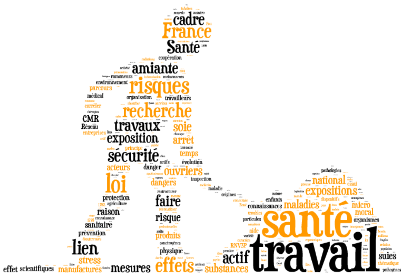
La Santé au travail (Auteur : Nathalie Ruaux)