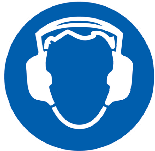
Pictogramme : Obligation d'équipement antibruit

Reconnue comme cause de maladies professionnelles 28 depuis 1963, la nuisance sonore est évaluée sur les lieux de travail au moyen d'indicateurs normalisés et/ou réglementaires. Certains secteurs d'activité industrielle sont réputés comme bruyants : bâtiment et travaux publics (BTP), construction automobile et des équipements mécaniques, industrie du bois et du papier, métallurgie et transformation des métaux, industrie des minéraux, production du béton, etc.