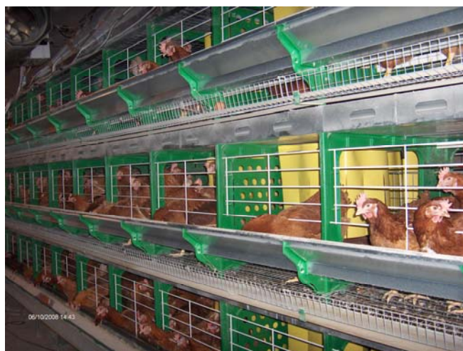
Les élevages de poules pondeuses

Depuis 2005, l'étude épidémiologique AIRPOUL suit une cohorte de 60 éleveurs de poules pondeuses afin d'évaluer leur exposition aux poussières aériennes et son impact sur leur santé respiratoire. La moitié des éleveurs travaille dans des poulaillers avec des cages et l'autre moitié dans des bâtiments où les poules sont au sol.