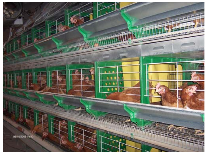
Les élevages de poules pondeuses

Depuis 2005, l'étude épidémiologique AIRPOUL suit une cohorte de 60 éleveurs de poules pondeuses afin d'évaluer leur exposition aux poussières aériennes et son impact sur leur santé respiratoire. La moitié des éleveurs travaille dans des poulaillers avec des cages et l'autre moitié dans des bâtiments où les poules sont au sol.