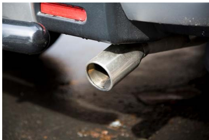
Les gaz d'échappement

Ces évènements participent à l'activation du RAH et/ou du récepteur \alpha aux estrogènes par les hydrocarbures ou au moins la modulent et régulent aussi les gènes cibles. Ils sont par conséquent susceptibles de jouer un rôle majeur dans les effets hormonaux des hydrocarbures aromatiques.