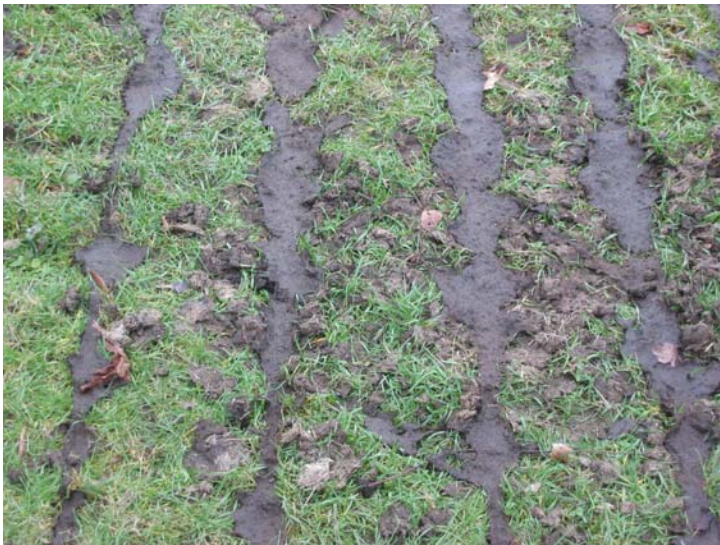
Epandage de boues : tracés

(Auteur : Rasbak, GNU Free Documentation Licence - Creative Commons générique 3.0)