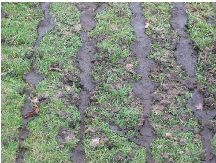
Epandage de boues : tracés

(Auteur : Rasbak, GNU Free Documentation Licence - Creative Commons générique 3.0)