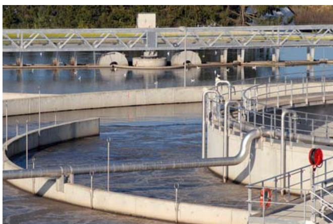
Station d'épuration

L'eau et notamment l'eau potable est un élément indispensable à la vie et pour la plupart des activités humaines. Pour rendre l'eau potable, on applique des traitements depuis son point de captage (l'origine de l'eau) jusqu'à sa distribution aux usagers. Les microorganismes (bactéries, virus, parasites...) qu'elle contient sont, pour la plupart éliminés en plusieurs étapes successives. La qualité des eaux distribuées dépend de celle de l'eau qui est captée, donc indirectement des eaux rejetées par l'homme.