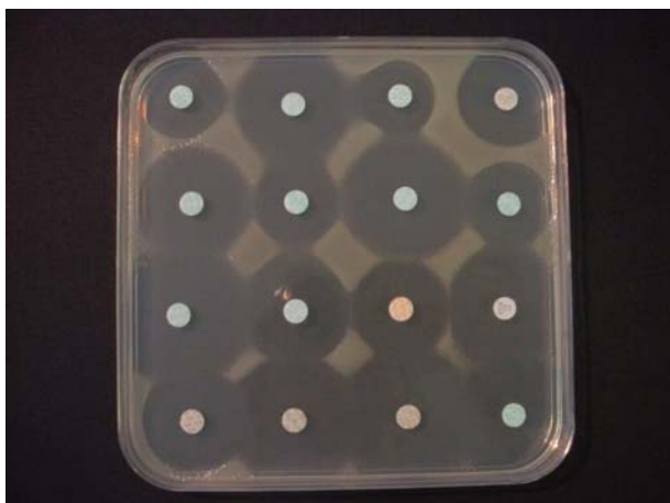
Antibiogrammes par diffusion E. coli ne présentant pas de résistance aux 16 antibiotiques testés

Plus que jamais ces actions combinant la surveillance des usages et l'apparition de résistances sont nécessaires.