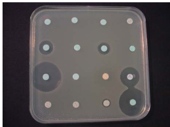
E. coli résistant à 13 antibiotiques sur les 16 testés