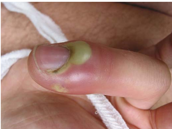
Forme typique d'un panaris à Staphylococcus aureus. (Auteur : Uwe Jendricke)

Le staphylocoque est l'une des principales bactéries pathogènes pour l'homme. Des souches de staphylocoques dorés 54 résistantes à la méthicilline (SARM) ont émergé dès les années 1960 et se sont depuis, largement diffusées à l'hôpital. On parle alors de souches nosocomiales, c'est-à-dire trouvées à l'hôpital 55 . Par ailleurs, depuis une dizaine d'années, de nouvelles souches de staphylocoques dorés résistantes à la méthicilline sont apparues en communauté, à l'origine d'infections graves chez des individus ne présentant pourtant aucun facteur de risque classique 56 : les SARM-AC 57 . Ces bactéries restent sensibles à plusieurs antibiotiques mais, leur potentiel épidémique et de virulence est supérieur à celui des souches nosocomiales.