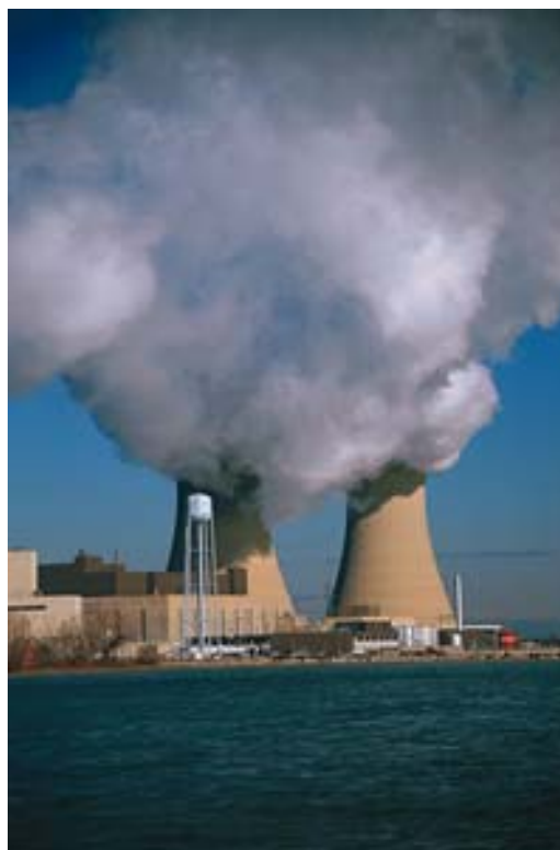
Illustration 16 : Centrale nucléaire

puis on a estimé le niveau d'exposition des enfants à un agent donné à partir d'une modélisation qui prend en compte cette distance et des caractéristiques des sources et du transport de cet agent. Cette approche cas-témoins est la seule possible, lorsque les expositions étudiées sont de courte durée (ex. lignes à haute tension, trafic routier) et ne peuvent pas être correctement estimées à l'échelle des communes ou de tout autre découpage géographique.