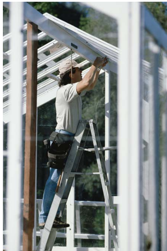
Illustration 28 : Risques de TMS

Ainsi, la comparaison de ces données a permis de tester non seulement la robustesse des modèles (basés sur des diagrammes reliant ces facteurs), mais aussi de prendre en compte les liens complexes entre facteurs sociaux et