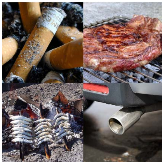
Illustration 39 : Les amines hétérocycliques (AHA)

l'environnement : PhIP, MeIQx, IQ 122 et AαC 123 . Les effets de ces AHA ont été observés sur trois modèles cellulaires humains les plus pertinents (foie, lymphocytes, intestin). Une forte variabilité de susceptibilité entre les individus et la compréhension des mécanismes d'action ont été mis en évidence.