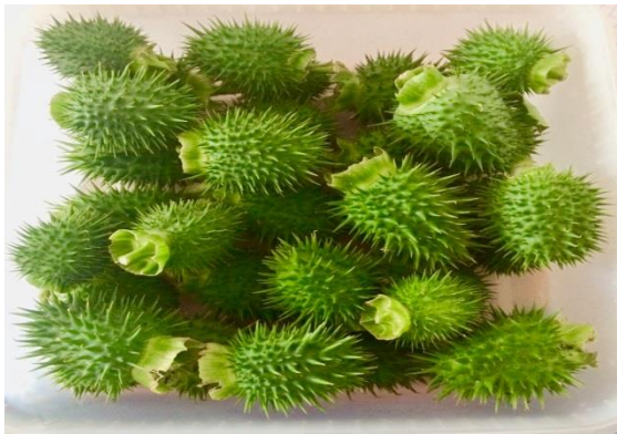
Figure 1 : Fruits du Datura

Les Datura représentent un genre de plantes bien connu pour leurs fleurs majestueuses en forme de trompettes, et sont souvent cultivées pour agrémenter les jardins. Certaines espèces comme Datura stramonium L. poussent également à l'état sauvage au gré du vent, là où on ne l'attend pas forcément. Le fruit est une capsule (cf. figure 1 ), mesurant de 5 à 10 cm de diamètre, recouverte d'épines effilées et qui contient un grand nombre de graines (plusieurs centaines).