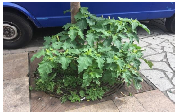
Figure 3 : Datura à l'état sauvage en zone urbaine

À la suite de ce signalement, une information a été transmise au Ministère de l'intérieur par la Direction générale de la santé, pour demander aux municipalités de procéder à l'arrachage des Datura surtout dans les lieux fréquentés par les jeunes publics. En Nouvelle Aquitaine, le CAP, la Cellule d'Intervention en Région (CIRE) de Santé Publique France, et le Centre d'Evaluation et d'Information sur la Pharmacodépendance et l'Addictovigilance (CEIP-A), en collaboration avec l'Agence Régionale de Santé (ARS) de Nouvelle Aquitaine ont transmis cette demande aux professionnels municipaux en charge de l'entretien des espaces verts pour une mise en application dans leur travail quotidien.