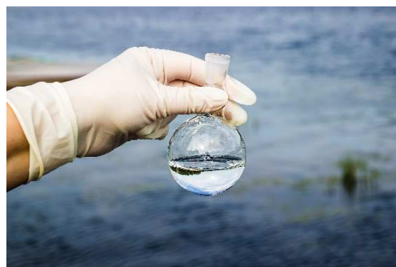
Illustration 22 : La surveillance de l'eau

Le rejet constant de polluants dans l'environnement et leur présence dans la chaîne alimentaire constituent une menace à la fois pour l'équilibre de l'environnement et pour la santé humaine. Une prise de conscience récente est en train de changer les comportements individuels. Ainsi, afin de protéger le consommateur, de nombreuses réglementations nationales et européennes ont été mises en place, fixant des Limites Maximales de Résidus (LMR) dans les produits destinés aux alimentations humaine et animale.