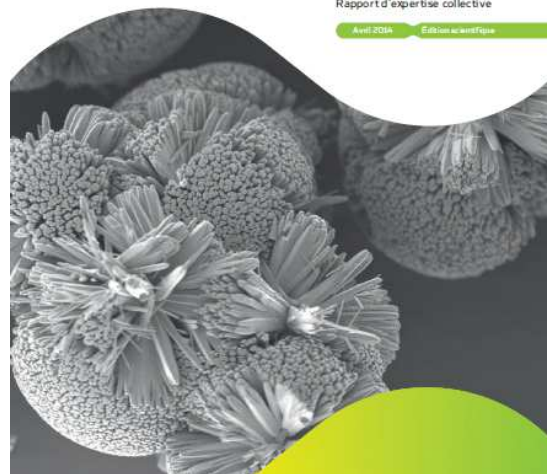
Illustration 7 : Évaluation des risques liés aux nanomatériaux (Anses, Édition scientifique, avril 2014)