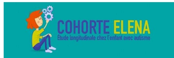
Illustration 11 : Cohorte ELENA, étude longitudinale chez l'enfant avec autisme