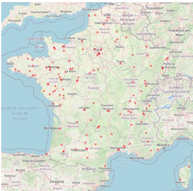
Figure 1. Répartition géographique des laboratoires partenaires adhérants au réseau Salmonella en 2019. Chaque point rouge représente un laboratoire. Les laboratoires situés dans les départements et régions d'outre-mer et collectivités d'outre-mer ne sont pas représentés sur cette carte.

Parmi ces 135 laboratoires, 127 sont situés en France métropolitaine, quatre à la Réunion, deux en Guadeloupe, un en Polynésie française et un en Nouvelle-Calédonie (Figure 1).