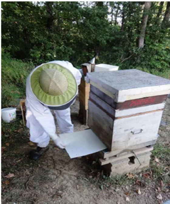
Photo 4 : La mise en place d'un support sous le plancher grillagé de la ruche peut permettre d'évaluer le niveau d'infestation sans ouvrir la ruche