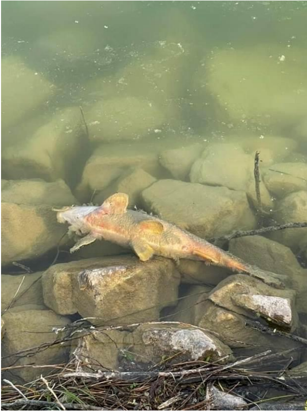
Figure 2. Carpe morte dans le plan d'eau d'Aquaval (Lautrec).

Labessonnié) et La Raviège (communes d'Anglés, Lamontellarié et La Salvetat sur Agout).