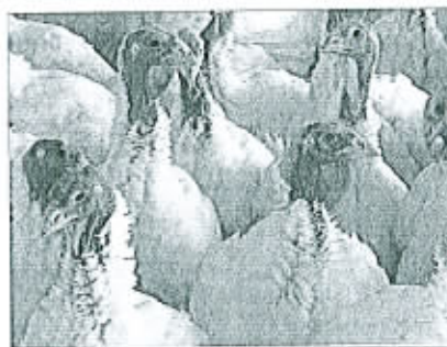
3 Un outil d'épidémiologie-surveillance a été mis en place dans la filière volailles par la création d'un observatoire des consommations d'antibiotiques en aviculture.