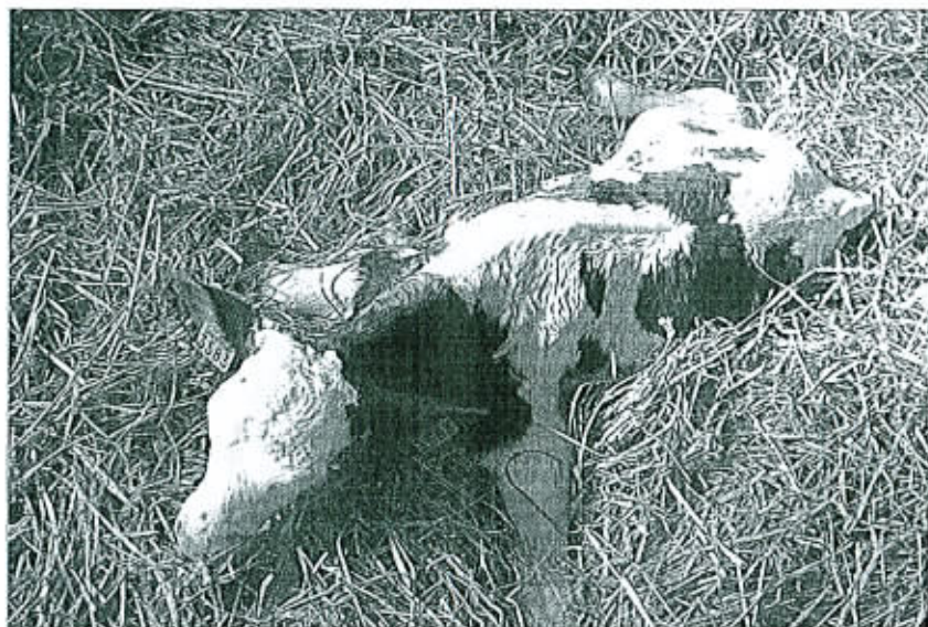
Souvent peu documentés, les échecs thérapeutiques associés à la résistance aux antibiotiques font partie de l'expérience des vétérinaires praticiens.

L e développement de la résistance aux antibiotiques remet en cause l'efficacité des traitements prescrits. Cet article présente les dispositifs mis en place dans les principales filières de productions animales, discute leurs apports et leurs limites en fonction de l'expérience acquise et dégage des perspectives pour la filière bovine.